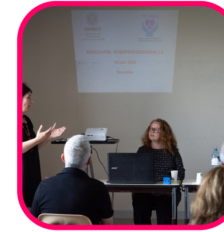
RENCONTRE PROFESSIONNELLE PRATICIENS