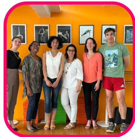
JOURNÉE ATELIERS PRATIQUES CITOYENS

S nergies, A ctivités, R encontres pour être C o- A cteur et N ovateur en prévention santé