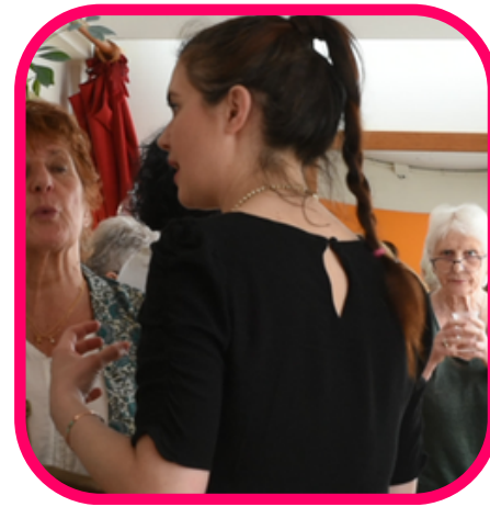
RENCONTRE CONVIVIALE PRATICIENS & CITOYENS