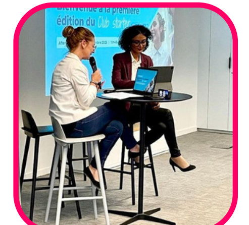
CONFÉRENCE À THÈME ORGANISATIONS